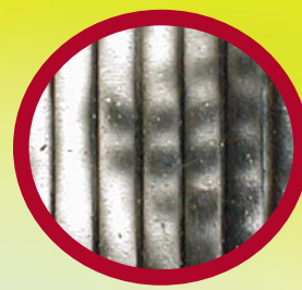
Voorbeeldfoto, resultaat na ca. 6 maanden.